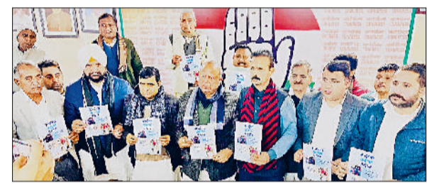
पानीपत। पत्रकारों से बातचीत करते कांग्रेस नेता।