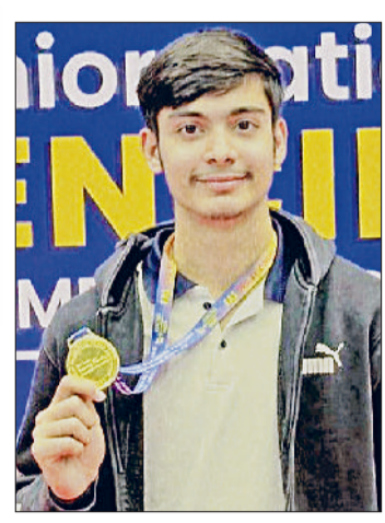
हरिभूमि न्यूज समालखा

टूर्नामेंट में देशभर से 18 राज्यों की टीमों ने हिस्सा लिया था