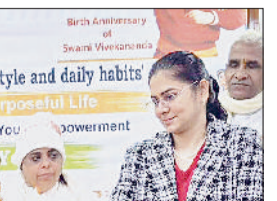
पानीपत। दीप प्रज्वलित कर कार्यक्रम का शुभारंभ करते अतिथिगण।

जिसमें देशभर से लगभग 100 युवाओं ने भाग लिया। मुख्य विषय फुल स्टॉप और फुल स्टॉक रहा। ब्रह्माकुमारी कृति मुख्य अतिथि