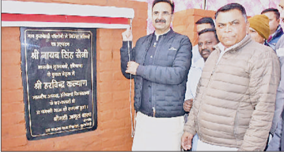
करनाल। विकास कार्यों का उद्घाटन करने विधानसभाध्यक्ष हरविंदर कल्याण।

वार्ड नंबर 1 में विभिन्न स्थानों पर मैस्टिक एस्फाल्ट लेयर बिछाने का कार्य 20.96 लाख रुपये, वार्ड नंबर 4 में विभिन्न स्थानों पर सड़क व नाली की मरम्मत 17.15 लाख रुपये, वार्ड नंबर 4 में सिविल अस्पताल से मन्नत डेयरी तक बॉक्स टाइप आरसीसी ड्रेन का निर्माण 30.16 लाख रुपये, वार्ड नंबर 5 में विभिन्न स्थानों पर सड़क व नाली की मरम्मत 20.88 लाख रुपये, वार्ड नंबर 8 में अनिल की दुकान से दलपि सिंह/मंदिर तक एवं दुर्गा कॉलोनी के विभिन्न