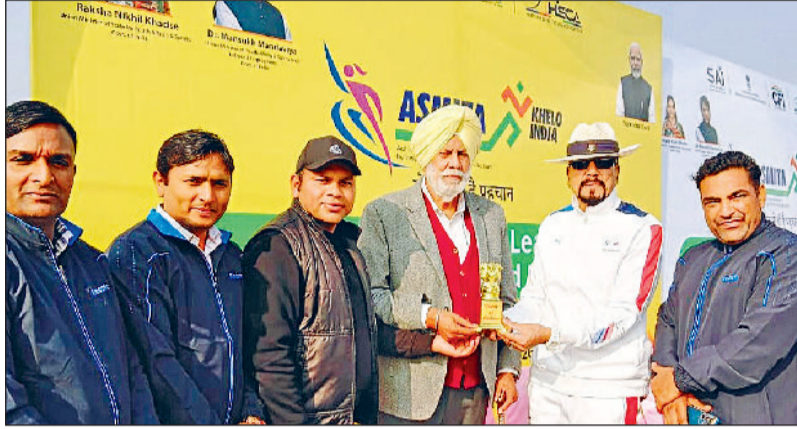
कुरुक्षेत्र। अतिथियों को सम्मानित करते आयोजक।