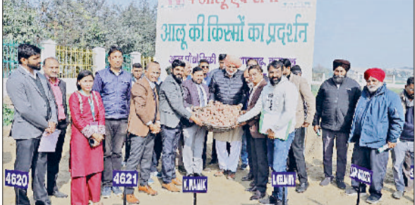
करनाल। आलू एक्सपो कार्यक्रम में मौजूद कृषि मंत्री श्याम सिंह राणा।

हरियाणा बागवानी विभाग द्वारा आयोजित चौथा आलू एक्सपो दो दिवसीय कार्यक्रम के उपांतर सफलतापूर्वक संपन्न हुआ। इस राज्य स्तरीय आयोजन में हरियाणा सहित उत्तर प्रदेश, पंजाब, हिमाचल प्रदेश एवं अन्य राज्यों से आए प्रगतिशील किसान, बीज उत्पादक, वैज्ञानिक, आलू क्रेता-विक्रेता, सार्वजनिक व निजी क्षेत्र की कृषि कंपनियों के प्रतिनिधियों ने उत्साहपूर्वक भाग लिया। एक्सपो का मुख्य उद्देश्य आलू उत्पादन की नवीन तकनीकों का प्रदर्शन, उच्च गुणवत्ता